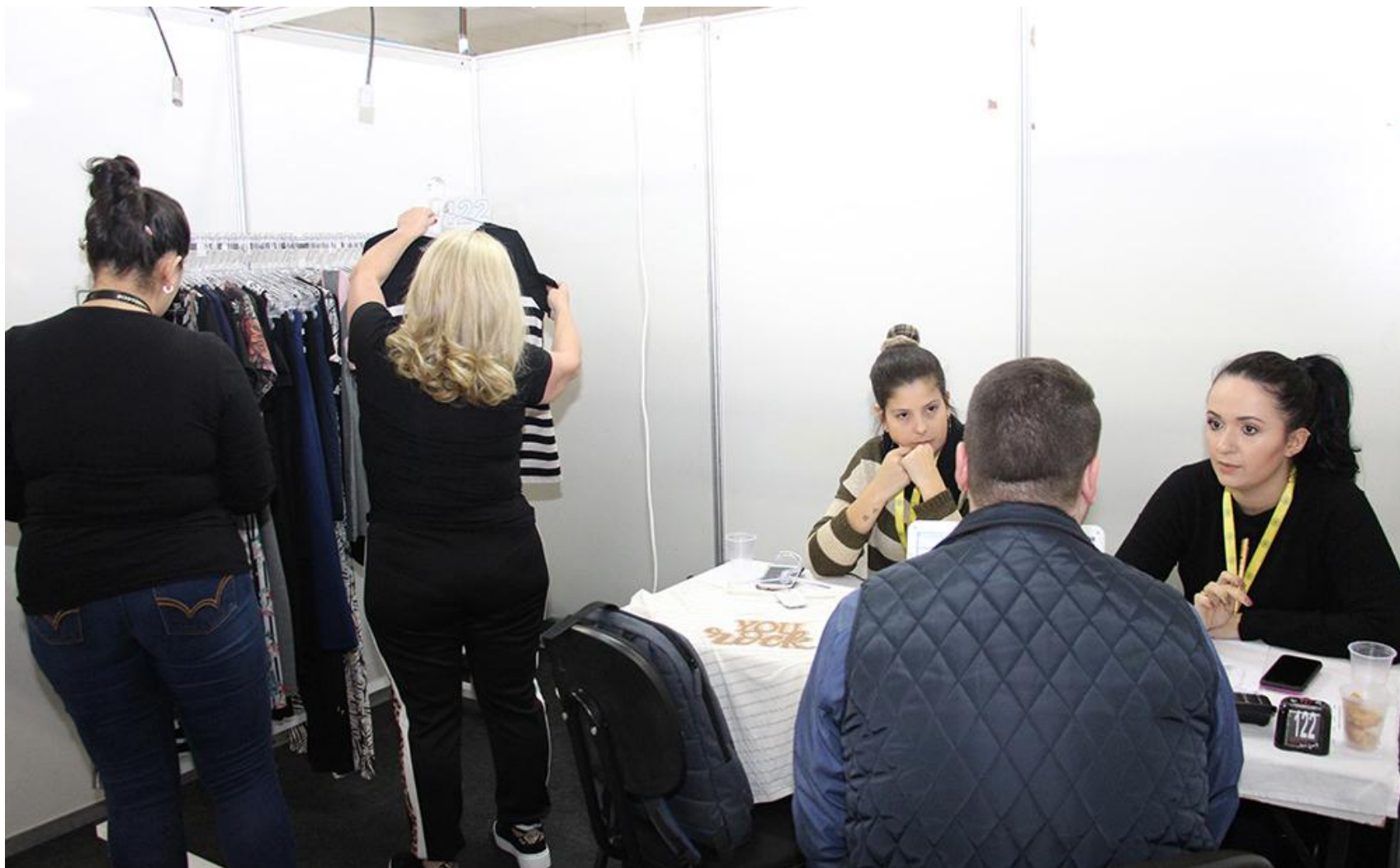
A AmpeBr terá uma equipe especializada disponível para auxiliar compradores e vendedores no suporte on-line e para esclarecimento de dúvidas que possam surgir durante as negociações

Interessados em participar da Pronegório Web podem entrar em contato com a AmpeBr para a pré-inscrição. Mais informações: (47) 3351-3811 ou pelos e-mails: administracao@ampebrusque.com.br ou pronegocio@ampebrusque.com.br .